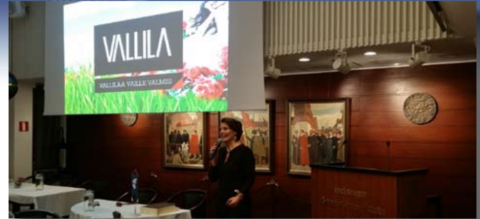
Anne Berner piti innostavan esitelmän

Globalisaatio on mahdollistanut kehittyvät markkinat ja niiden sisämarkkinoiden kasvun. Innovaatioiden liikkuvuus on parantunut ja urbanisoituminen tuottamalla omat ilmiönsä. Koulutuskeskukset ovat siirtyneet Intiaan ja Kiinaan. Samalla muuttuvat arvot, painopisteet ja johtamisopit. Lännessä meillä on sama arvopohja, joka perustuu uskontoon, tapoihin, työelämään, toimimme samojen oppien mukaan. Idässä arvopohja on erilainen. Siellä ihmiset uskovat, että tekemällä nyt hyvää muille ja palvelemalla muita, voi saada seuraavassa elämässä vielä paremman osan. Tämä uskomus toimii hyvänä fasilitaattorina ja kannustajana yrittäjyyteen.